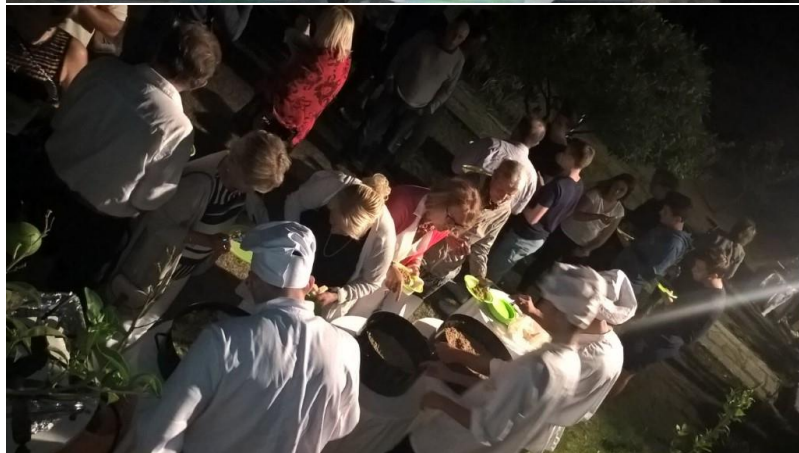
ZAHVALA-15o godina Viškog boja