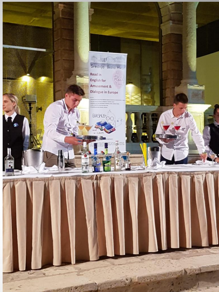
Cocktail show Srednje škole Hvar